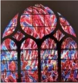
Figure Vitrail de J.Bazaine

Et pour ce faire, “D’ABORD CHANGEONS DE LUNETTES et invoquons l’Esprit Saint” !