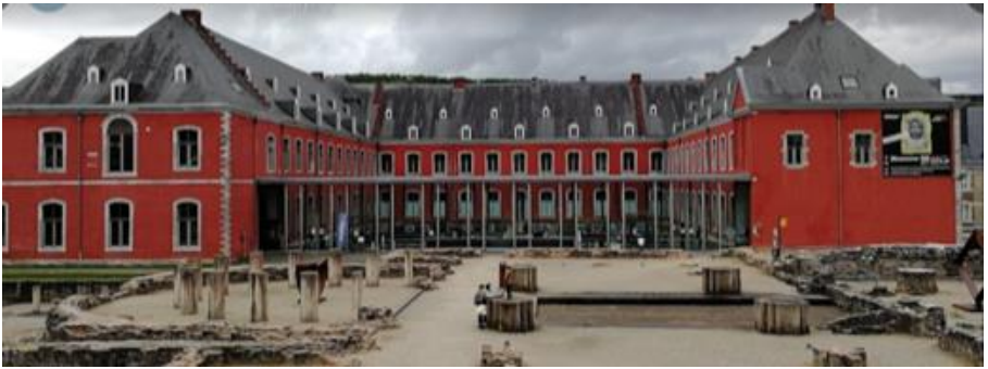
Abbaye de Stavelot