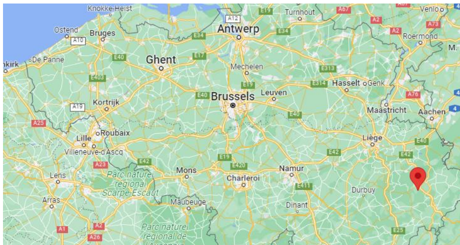
Carte de la région actuelle de Lodomez (point rouge sur la carte)